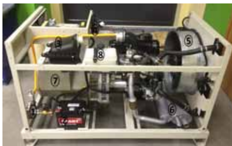
Рис. Генераторная установка ФАС-OZP/VD