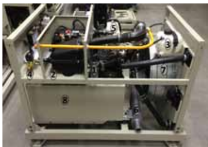
Рис. Генераторная установка ФАС-OZP/V

Для осуществления контроля и управления выходной мощностью и защиты от возможных сбоев в работе установка оснащена контроллером (подробная информация о настройке контроллера – в разделе 9).