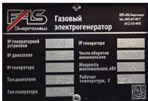
Рис. Табличка-шильда паспортных данных генераторной установки

Каждая генераторная установка имеет идентификационный номер, указанные на фирменном ярлыке-шильде (см. рис.), прикрепленном к основанию. Эта шильда содержит информацию о дате изготовления, напряжении, токе, мощности в кВА и кВт, частоте, коэффициенте мощности и массе генераторной установки. Эти данные необходимы для оформления заказов на запасные части, обоснования гарантии и заявок на сервисное обслуживание.